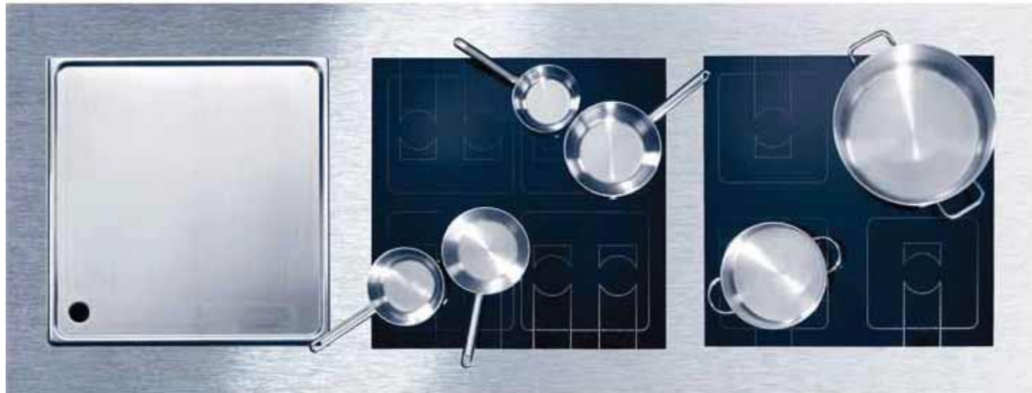
Patelnia indukcyjna, grill indukcyjny (2 pola) GI-MO/DU/GR 7000 (7kW) GI-MO/DU/GR 10000 (10kW)